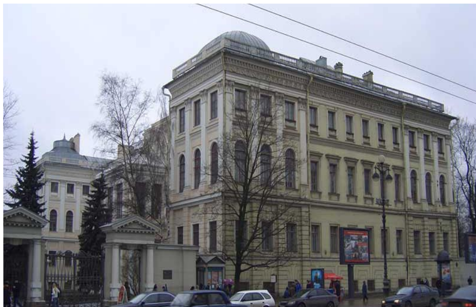
Здание Аничкова дворца - лакомый кусок для коммерсантов