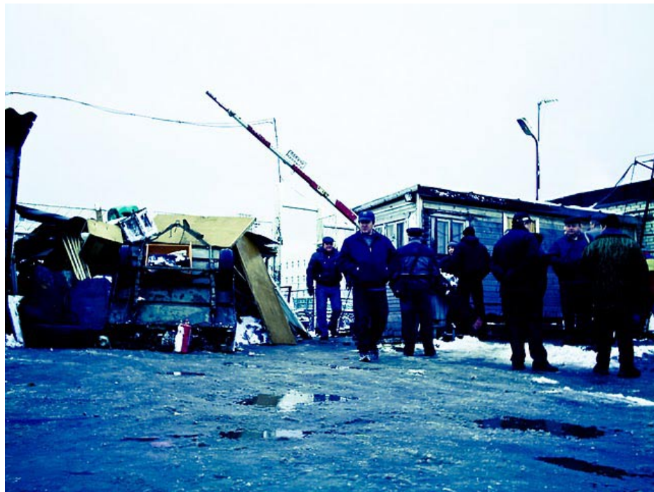
Баррикады на Парнасе

ники сделали максимум возможного в плане мобилизации людей. Многократно обзванивались все члены гаражных кооперативов, со всеми беседовали. Всем вручали листовки и газеты, всех оповещали об акциях. Профсоюз создал сайт, наладил связь со СМИ и дружественными организациями.