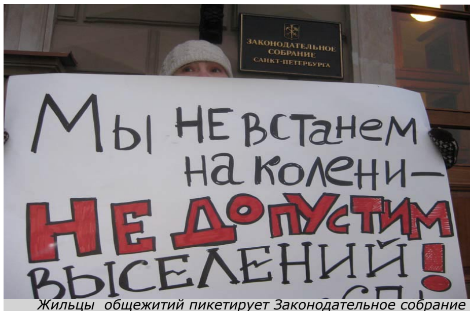
Жильцы общежитий пикетирует Законодательное собрание

женщину, воспитывающую в одиночку двух несовершеннолетних детей, один из которых – инвалид. В целом, несмотря на всяческие заверения чиновников (вплоть до губернатора), людей действительно выселяли на улицу. А тех, кого еще не выселили, официально перевели в категорию бездомных.